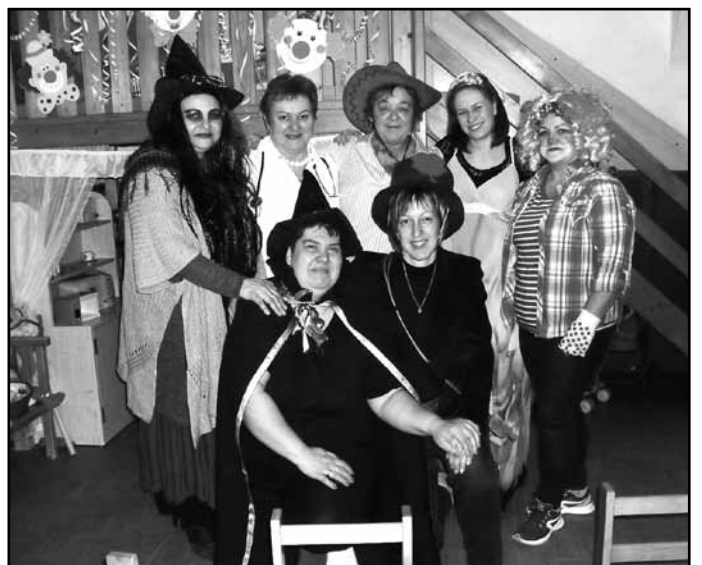
Kicsoda? - Micsoda?

A jelenlegi tagok is aktív résztvevői és segítői munkánknek. Figyelemmel kísérik az óvodai életet, minden napos tevékenységeket. Látják a körülményeket, érzékelik mindennapi gondjainkat és a javítás, minőségi fejlődés megvalósításán gondolkodnak velünk együtt. A fejlődés, fejlesztés anyagi ráfordítással is jár, ezért JÓTÉKONYSÁGI BÁLT szerveznek az óvoda javára. Részletekről későbbi lapszámában, és plakátokon tájékoztatjuk az olvasókat. Tervezett időpont 2017. június 10. (szombat).