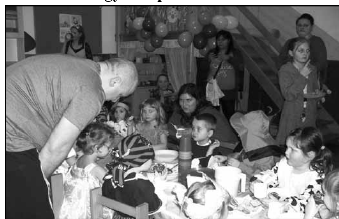
Finomabbnál-finomabb sütik Köszönjük anyukák!