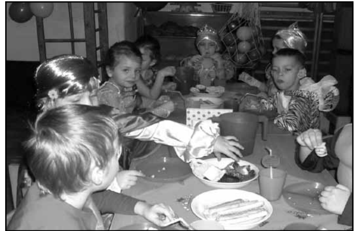
Terülj, terülj asztalkám