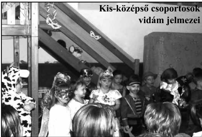
Kis-középső csoportosok vidám jelmezei