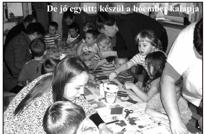
De jó együtt: készül a hóember kalapja