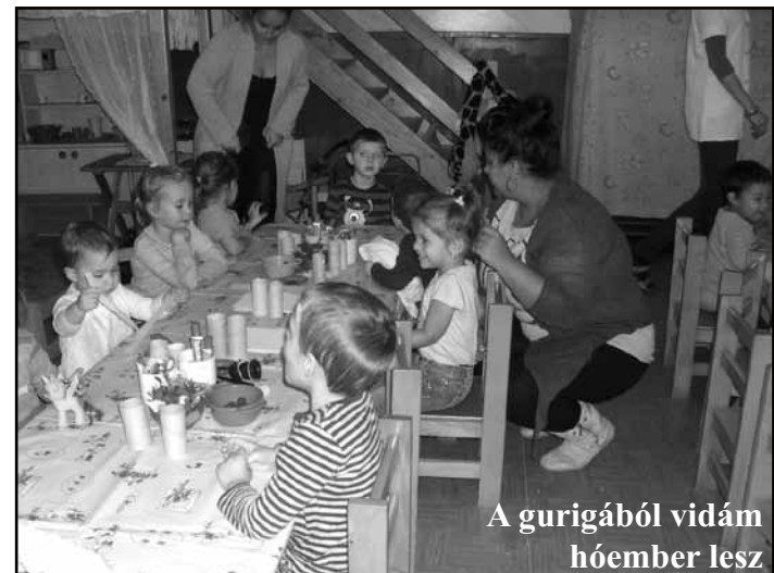
A gurigából vidám hóember lesz

Köszönjük mindazok támogatását, akik részt vettek és segítséget nyújtottak a Koronás Ovicukor pályázatban. Most Fortuna nem fogadott kegyeibe bennünket, a nyertes óvodának ezúton is gratulálunk!