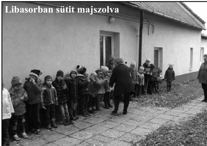
Libasorban sütit majszolva