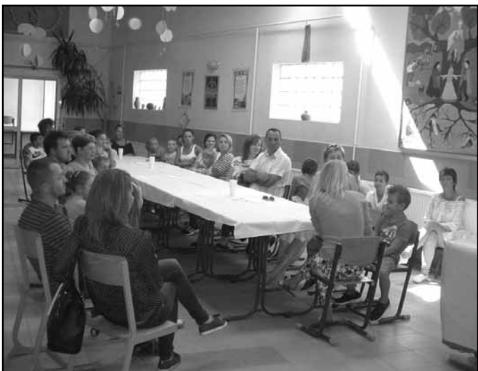
Az elsősök és szülei az aulában