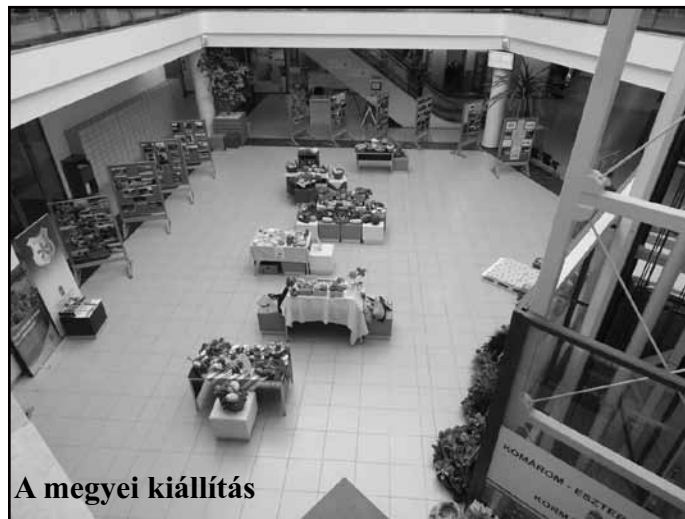
A megyei kiállítás