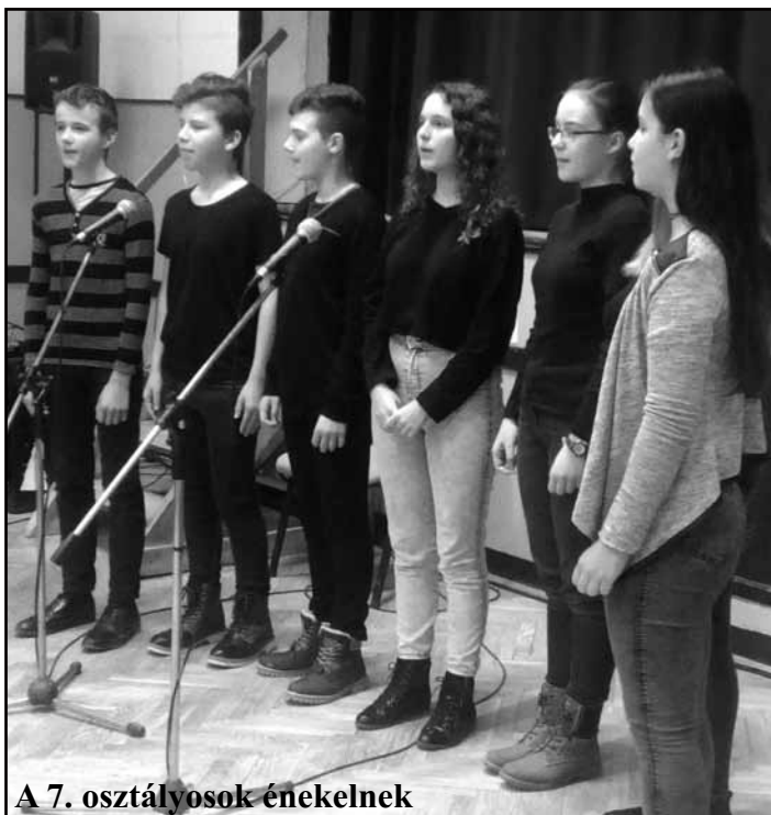
A 7. osztályosok énekelnek

Jegyeket vásárolni január 3-ától lehet az iskola titkárságán.