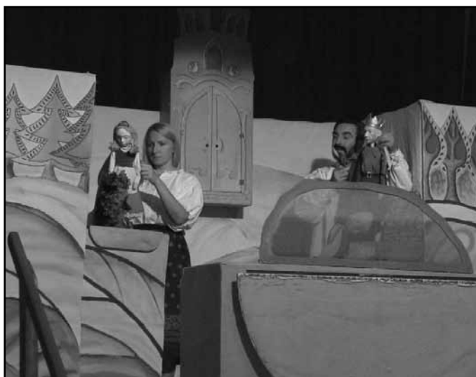
Az Ákom-Bákom együttes Kiskondás c. bábelőadása a Művelődési házban szeptemberben A kiskondás című bábelőadás