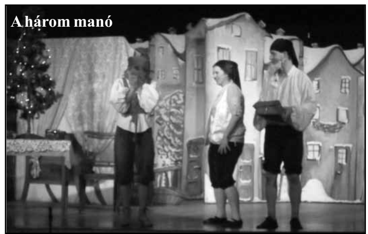
A három manó