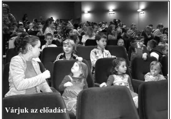
Várjuk az előadást

A készülődés hangulatát fokozta a színházlátogatás, Kisbéren néztük meg a „A suszter és a karácsonyi manók” történetét.