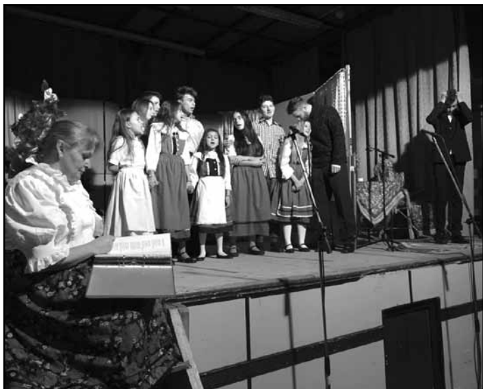
Adventi színházi műsor: Dévai Szent Ferenc Alapítvány – „Melyiket a kilenc közül?”