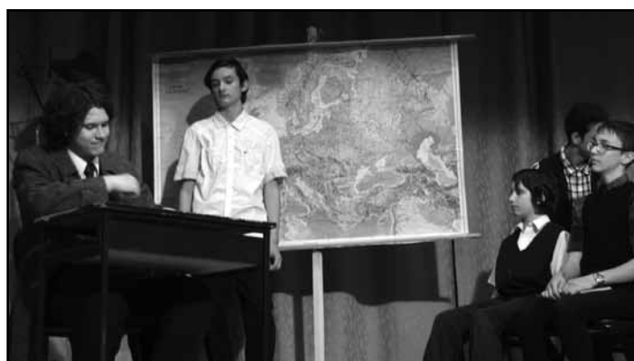
„Légy jó mindhalálig „ – Műsoros est előadás