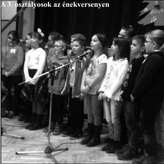
A 3. osztályosok az énekversenyen

Felléptek még karácsonyi énekversenyünk győztesei, a zeneiskolás gitárosok, valamint színjátszó csoportunk előadásában a „Kék madár” című jelenetet láthattuk. A színpadra lépő gyerekek igazi, meghitt karácsonyi hangulatot varázsoltak a színpadra