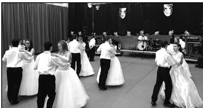
A tánc pillanatai