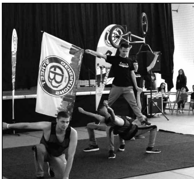
A Street Generation együttes műsora