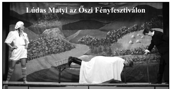
Lúdas Matyi az Őszi Fényfesztiválon