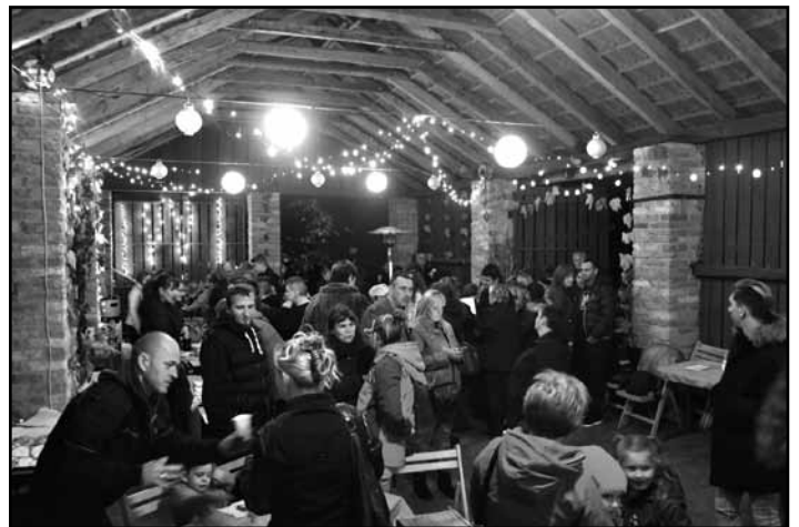
Őszi fényben a pajta