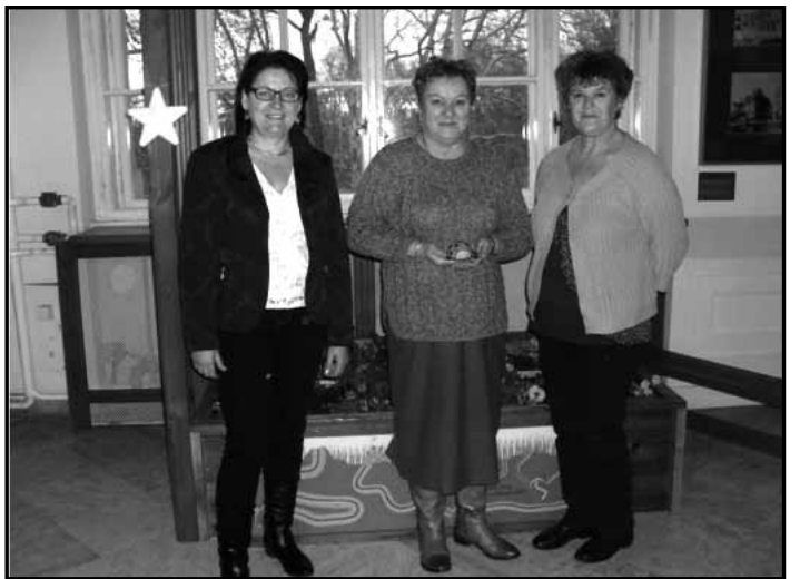
Kisbéri kolléganőikkel, az átadó ünnepségen

Ők már az örökös zöld óvoda cím méltán boldog tulajdonosai.