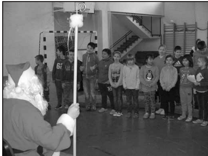
Itt járt a Mikulás

December 7-én a 8. osztályosok „Mikulásváró” délutánt tartottak a Közművelődés Házában. A könyvtár támogatásának köszönhetően az Ákombákom bábcsoport előadását nézhették meg „Mikulás a tyúkudvarban” címmel. Lehetett kézműveskedni, játszani, énekelni, karácsonyi ajándékokat vásárolni.