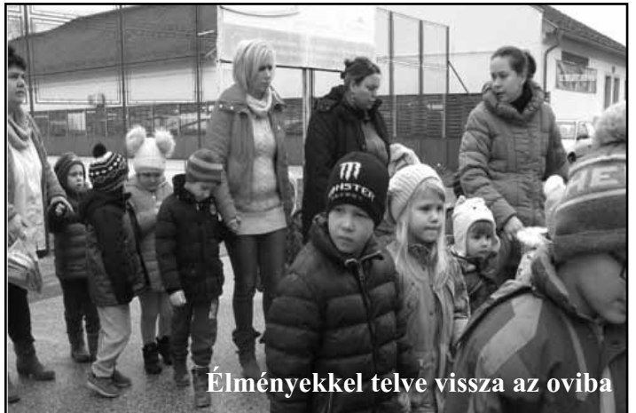
Élményekkel telve vissza az oviba