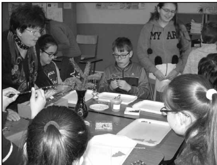
Adventi kézműves foglalkozás

December 2-án, szombaton kézműves foglalkozást tartottunk az iskolában. Adventi koszorúkat, karácsonyfa- és asztaldíszeket, gyertyákat alkottak gyerekek, szülők, pedagógusok együtt, várva a közelgő ünnepet. Elkészült iskolánk adventi koszorúja is, így hétfőnként nálunk is fellobbantak a gyertyalángok. Énekkarosaink szép, adventi dallal tették hangulatossá ezeket az alkalmakat