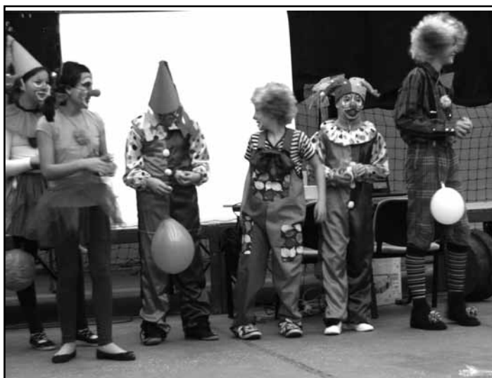
Az ötödikesek műsora