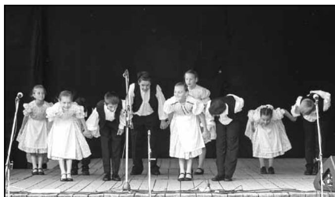
A Pántlika Néptáncsoport sikere a Járási Tehetségfesztiválon