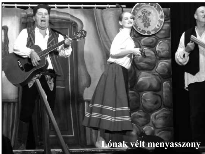
Lónak vélt menyasszony

A Közművelődés Házában a nézőtér zsúfolásig megtelt. A Budapesti Utcaszínház művészei léptek színpadra. Egy nagyon mulatságos és szórakoztató előadást vittek színre, címe a „Lónak vélt menyasszony” volt.