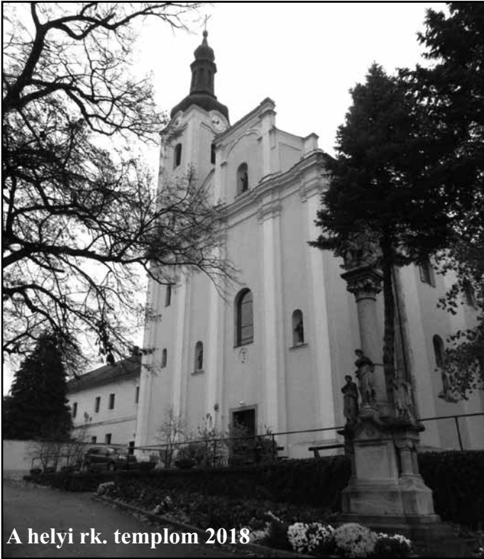
A helyi rk. templom 2018