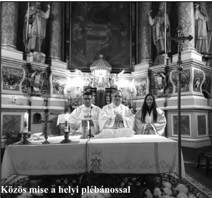
Közös mise a helyi plébánossal