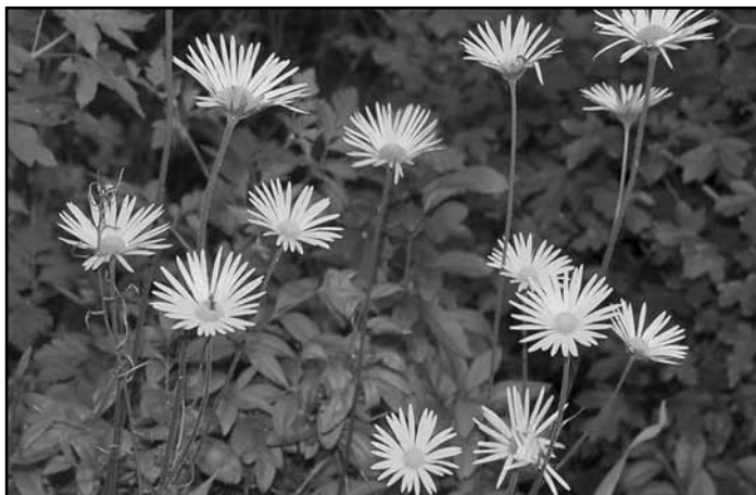
2019 vadvirága a - magyar zergevirág