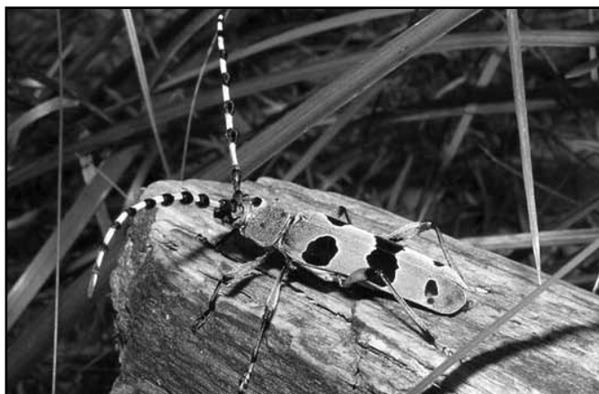
2019 rovara a - havasi cincér