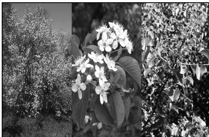
2019 fája a - sajmeggy