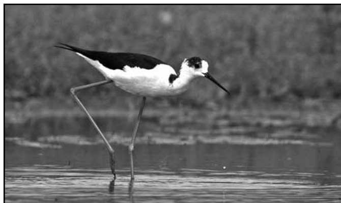
2019 madara a - gólyatöcs