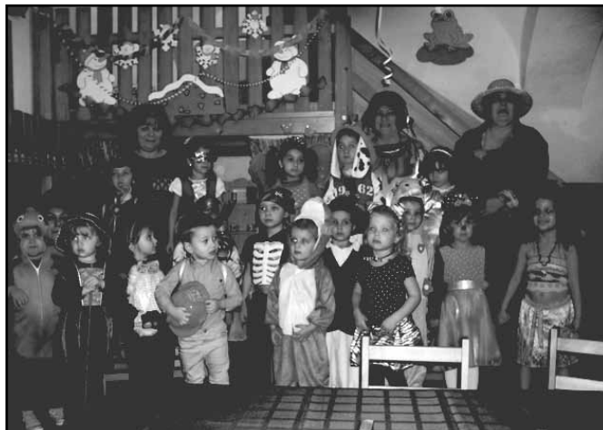
Kis - középső csoportosok

Köszönet a szülői szervezeti tagoknak a tombolák körül adódó munkájukért.