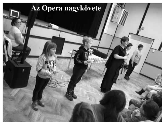
Az Opera nagykövete

az ott játszó zenekar felépítését, sőt a művésznő saját hangszerét is. Csodálatos játékával elkápráztattott minket.