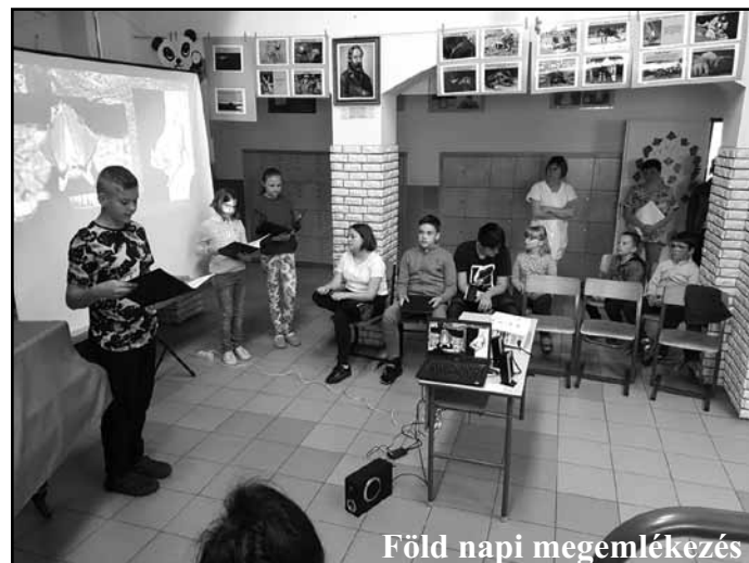
Föld napi megemlékezés

Kiselőadásukban a hajnalmadarat mutatták be a versenyen, mellyel a 2. helyezést mondhatták magukénak. Ezen a napon délelőtt iskolánk tanulói is megismerhették ezt a két fajt. A Föld napja alkalmából a kiselőadásokat az iskola tanárai és diákjai is megtekinthették. A kiselőadásokat prózai részlet, videó-és hangfelvételek, színes képanyag és saját készítésű rajz is színesítette.