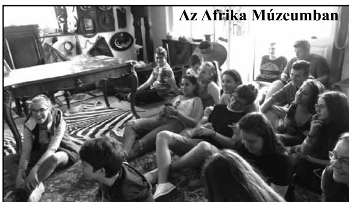
Az Afrika Múzeumban

Ha Balatonederics, akkor Afrika Múzeum és Állatkert. Itt élőben is láthattuk ugyanazokat az állatokat. Bejártuk a „dzsungelt” is, és nem hagytuk ki a kilátót