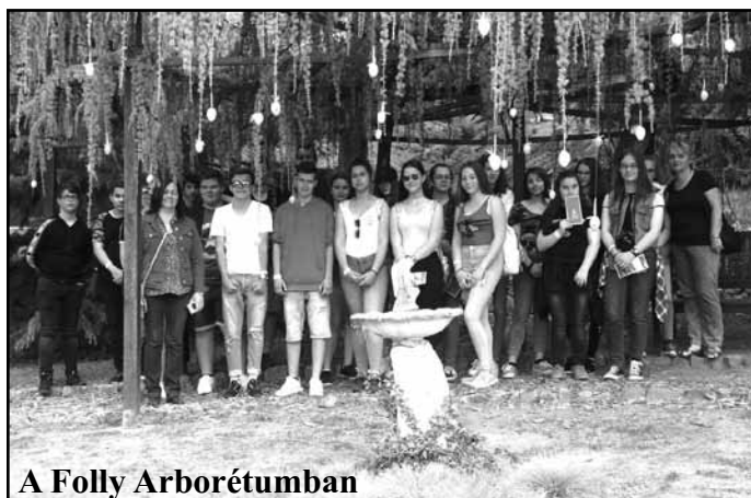
A Folly Arborétumban

A leghosszabb időt Keszthelyen töltöttük el. Nagyon sok mindent láttunk, és azt is, hogy milyen sok mindent nem! A Helikon Kastélymúzeum bejárása után sétáltunk a kastélyparkban, felkerestük a történelmi modellvasút kiállítást. Ez az egyik legnagyobb Európában.