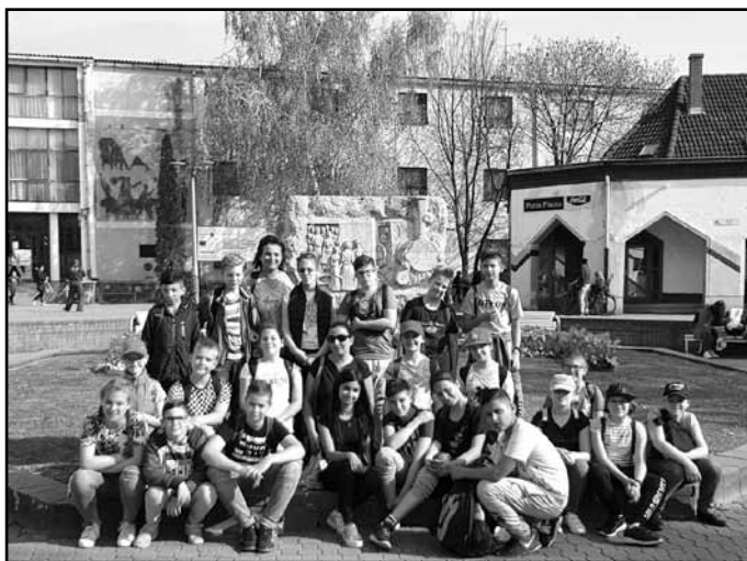
Az 5. osztályos erdei iskolások

„Április 10-én erdei iskolába mentünk az osztállyal Mezőkövesdre. Már nagyon izgatottan vártuk ezt a kirándulást, mert jobbnál jobb programokat tartogatott számunkra.