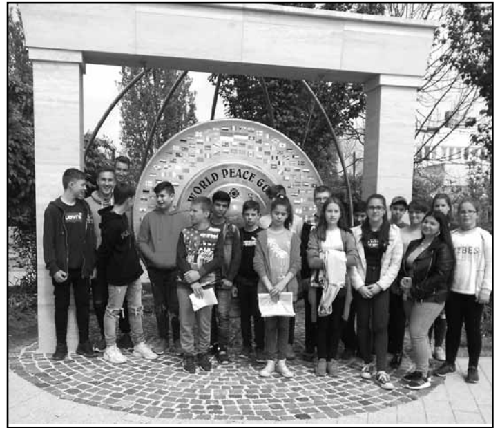
Gödöllőn a Világbéke gong előtt

Utunkat a főtéren folytattuk. Itt megnéztük és megszólaltattuk a Világbéke Gongot Az alkotás Indoné-