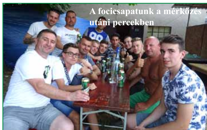
A focisapatunk a mérkőzés utáni percekben