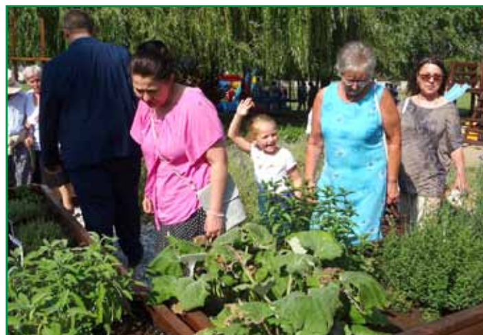
A kamocsai mezőtábas és gyógynövényes parkot is átadták a falunapon