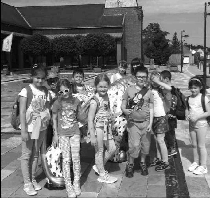
Herenden a legkisebbek

Az emberi világ több kell, legyen, mint egy bonyolult szerkezetű gép, melyben minden ember egy fogaskerék szerepét tölti be... Minden embernek kell, legyen egy feladata, egy titkos küldetése, mely Istentől való."