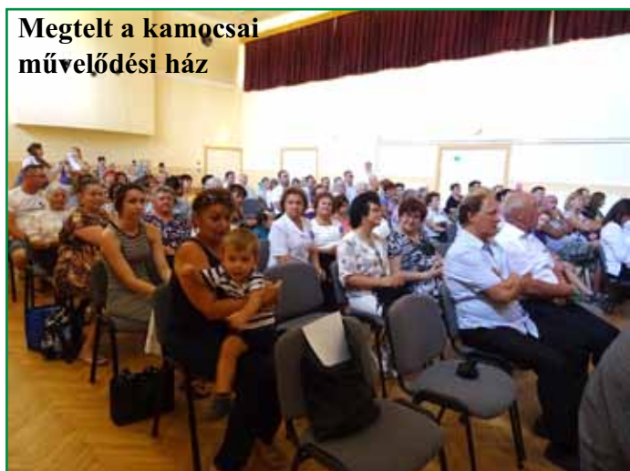
Megtelt a kamocsai művelődési ház