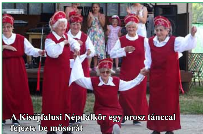
A Kisújfalusi Népdalkör egy orosz táncsal fejezte be műsorát