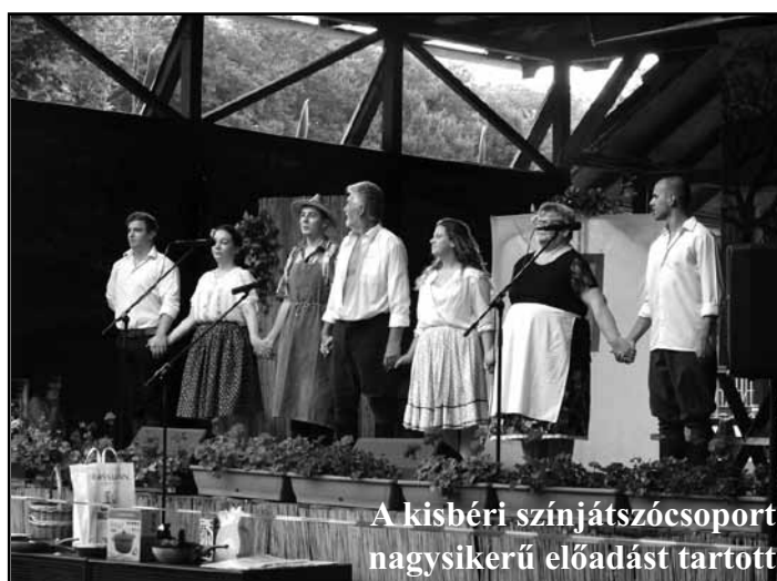
A kisbéri színjátszócsoporthoz nagsikerű előadást tartott