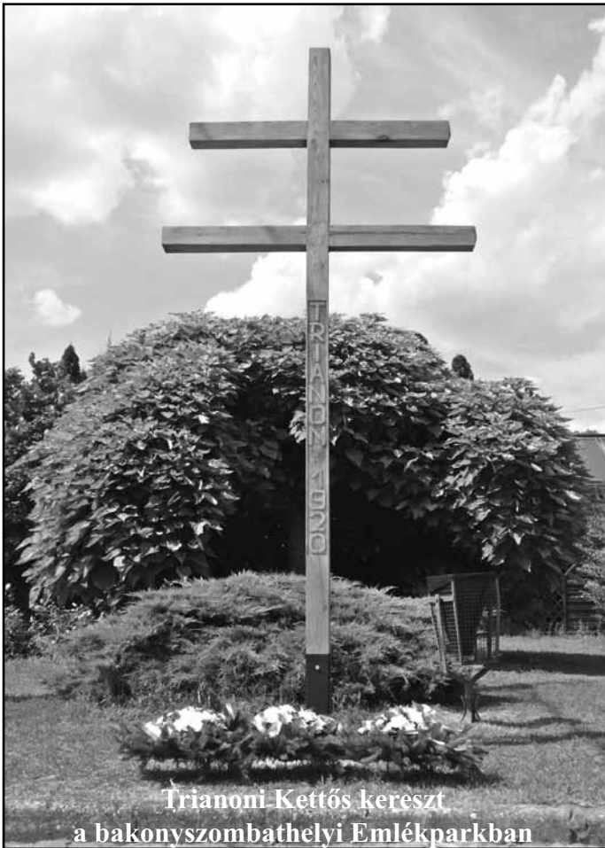
Trianoni-Kettős kereszt a bakonyszombathelyi Emléparkban