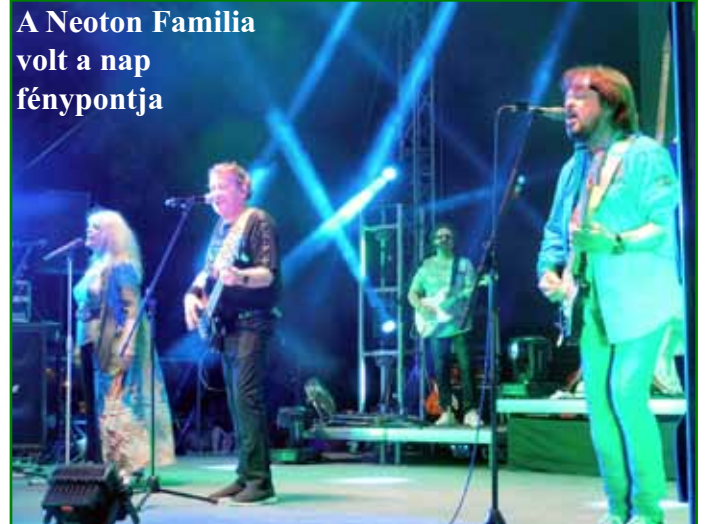
A Neoton Familia volt a nap fénypontja