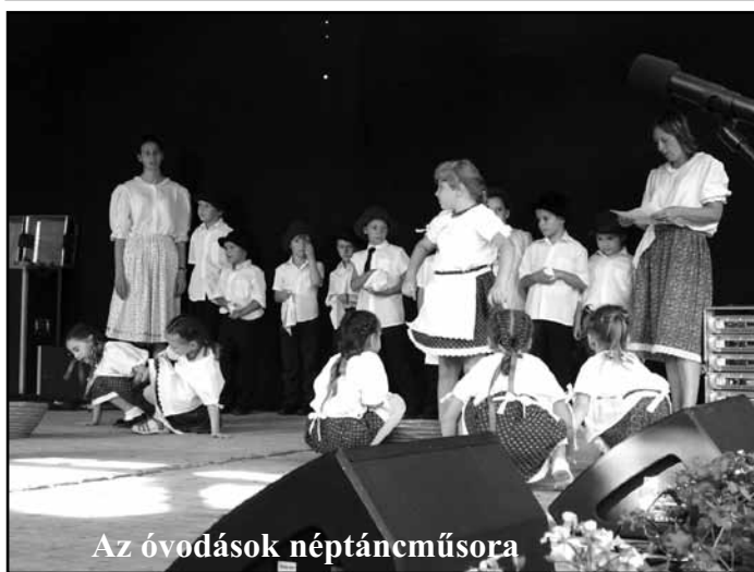
Az óvodások néptáncműsora