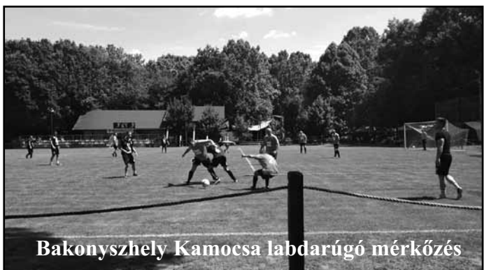
Bakonyszhely Kamocsa labdarúgó mérkőzés