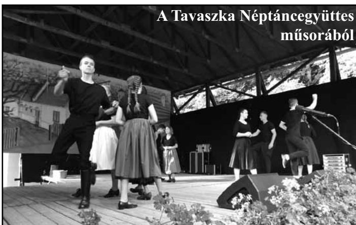
A Tavaszka Néptáncgyűjtés műsorából