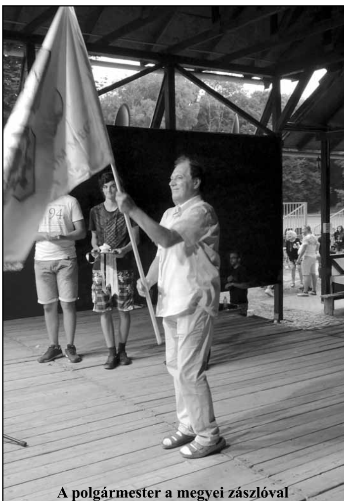
A polgármester a megyei zászlóval