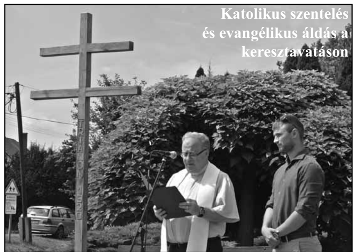
Katolikus szentelés és evangélikus áldás a keresztavatáson