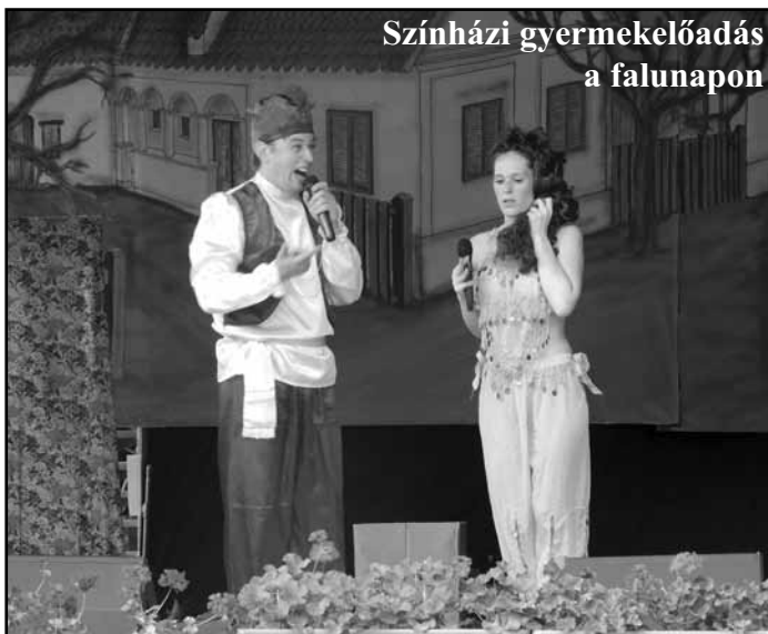
Színházi gyermekelőadás a falunapon