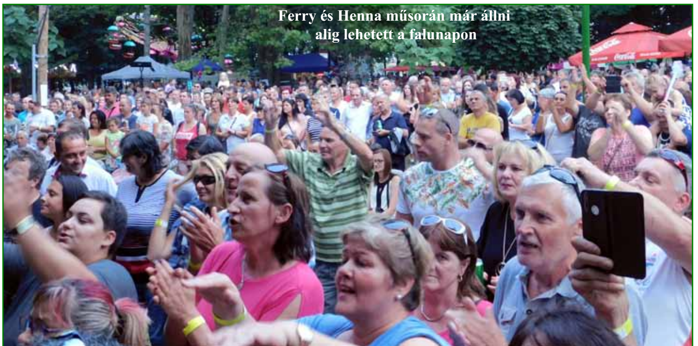
Ferry és Henna műsorán már állni alig lehetett a falunapon