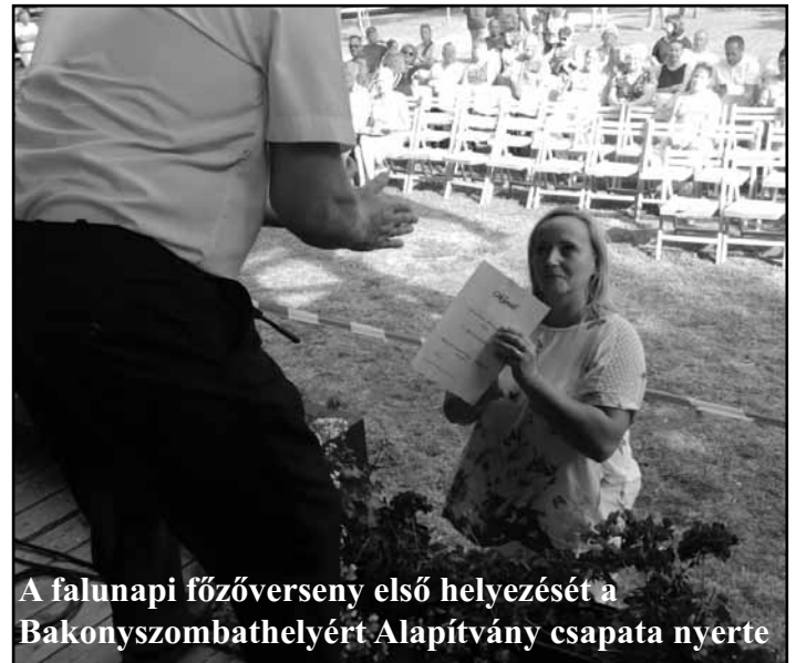
A falunapi főzőverseny első helyezését a Bakonyszombathelyért Alapítvány csapata nyerte