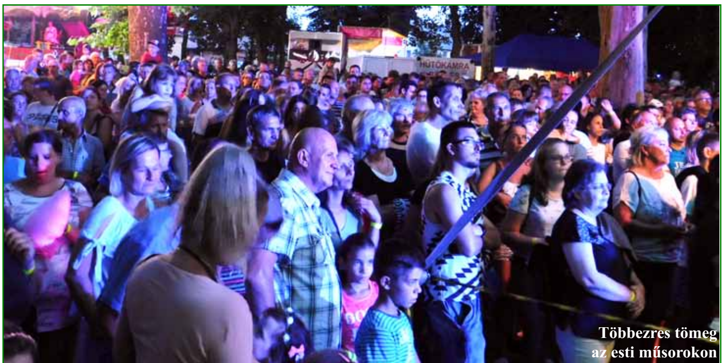
Többeszes tömeg az esti műsorokon