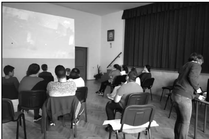
Az éjszaka csodái

Az éjszaka csodái. Ezzel a címmel tartott vetítést foglalkozással és játékokkal összekapcsolva