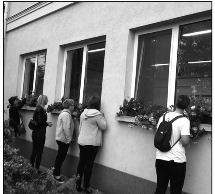
Érdeklődő elsős szülők az első napon

Sajnos a szokásos tanév eleji szülői értekezletünket nem tudtuk megtartani. A KRÉTA rendszerben feltüntettük a fogadóórák időpontjait. Kérjük a kedves Szülőket, hogy ezekben az időpontokban keressék fel telefonon vagy más, személyes találkozást nem igénylő módon a pedagógusokat gyermekeik iskolai munkájával kapcsolatban.