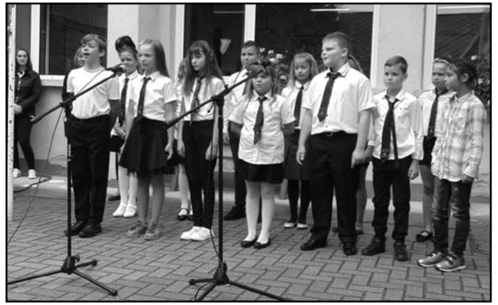
Az évnyitó műsort a 4. osztályosok adták