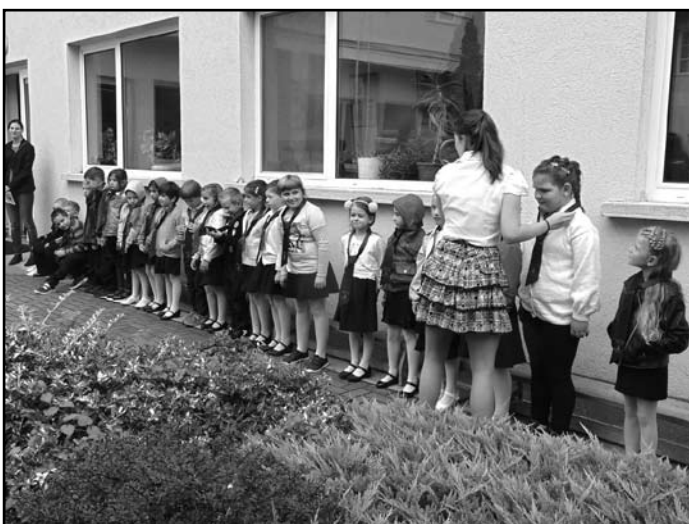
Az elsősöknek a 8. osztályosok kötötték fel az iskolai nyakkendőt