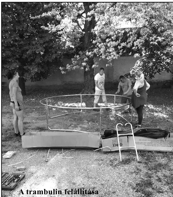
A trampulin felállítása