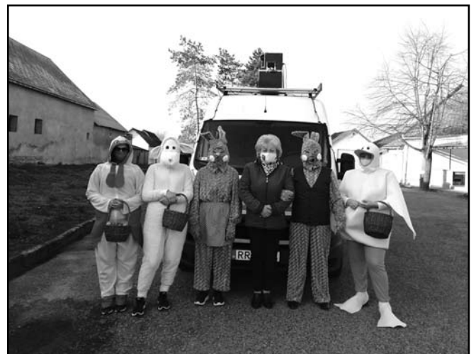
Az indulás pillanata

Továbbá köszönöm a Bakonyszombathelyért Alapítvány támogatását mellyel az idén a csapatot bővíthettük. Köszönjük a sok pozitív visszajelzést a lakosainktól!