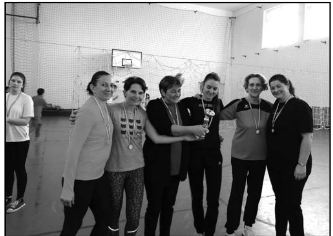
A női mezőny győztesei

2021. február 18-án a lánycsapatok léptek pályára, hogy összemérjék tudásukat.