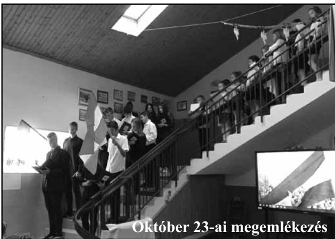
Október 23-ai megemlékezés

Október 23-a nemzeti ünnepünk. Az 1956-os eseményekre való emlékezésben a 8. osztályos tanulók segítettek. Verses-zenés összeállításukban nemcsak a nap eseményei elevenedtek meg, hanem a bukással végződött történések sorozatára, mai napig tartó hatására is rávilágítottak tanulóink műsorukban.