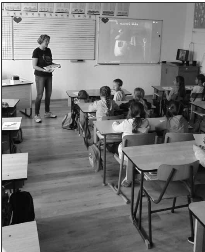
Mesedélelőtt a 2. osztályban