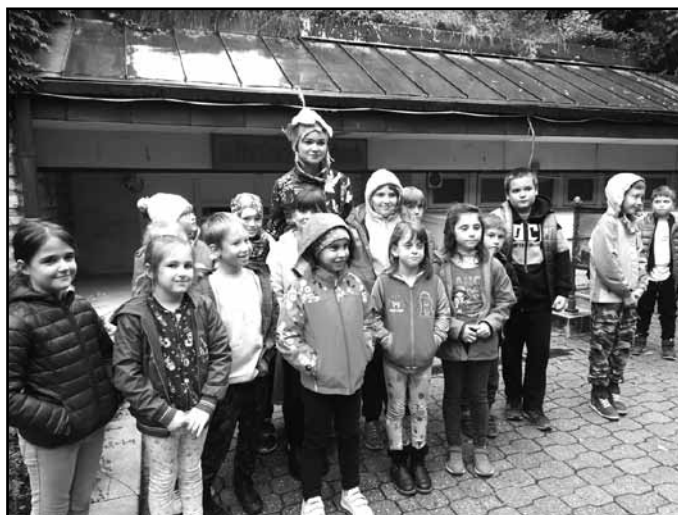
Kicsikkel a veszprémi színházban