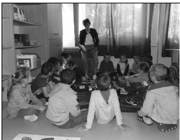
Mesedélelőtt az elsőben