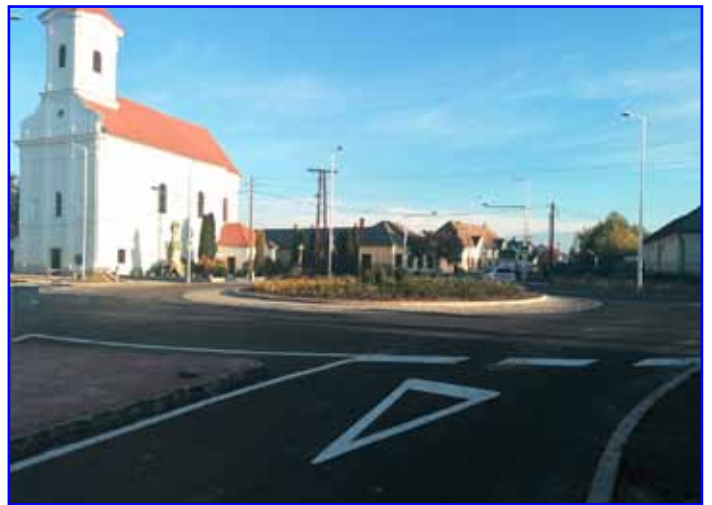
Az utolsó aszfaltréteg is felkerült

Ezt követően a 18-ai héten a növénytelepítés és kertészeti munkák következtek. Az ünnepélyes átadás időpontja még nem ismert, de erre is hamarosan sor kerül. Nehéz és eseménydús hónapokon vagyunk túl, de minden bosszúság ellenére elmondhatjuk, hogy ezzel a fél milliárdos állami beruházással nagyon régi