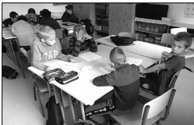
Mesedélelőtt a 3. osztályban