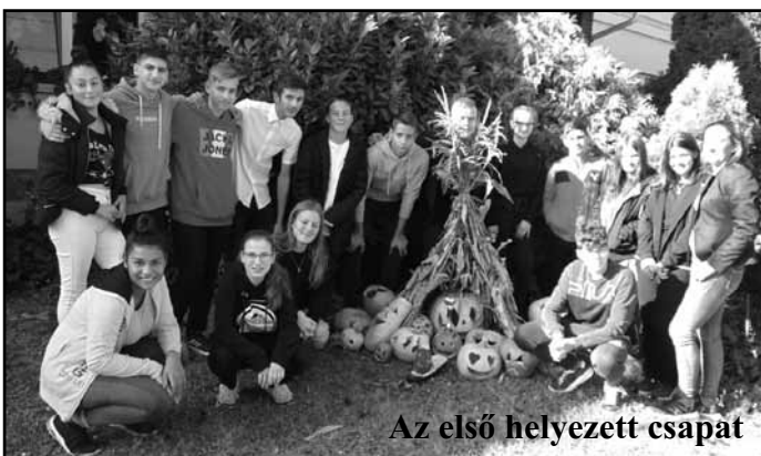
Az első helyezett csapat