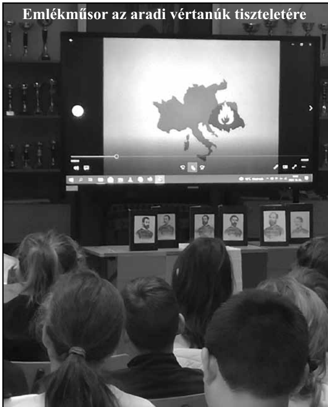
Emlékműsor az aradi vértanúk tiszteletére

készültek a megemlékezésre. Műsorukban felidéztek a 172 évvel ezelőtti eseményeket, a vértanúk alakját, emberi nagyságát.