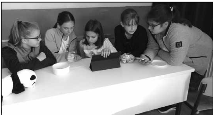
Vetélkedő a 6.-ban