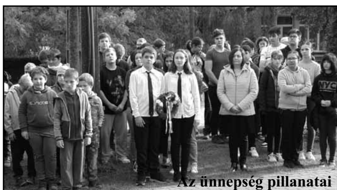
Az ünnepség pillanatai

„Csak az a nemzet érdemes jobb sorsra és örök életre, amely meg tudja becsülni nagyjait, és amelynek mindig szem előtt lebeg azok példát adó munkássága.” (Esterházy János)