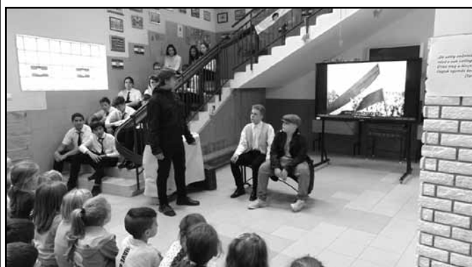
Az ünnepi műsort adó 8. osztály

„Te pesti srác, Te napköziben nevelkedett apró kamasz! Te, akinek élete mindössze Vagy tizenöt sivar tavasz. Téged, ki ezt a drága élted hazáért így adtad oda, amíg magyar él a földön: nem felejtünk el soha!” (Szentkúti Ferenc)