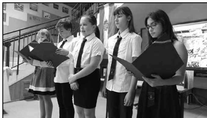
Az október 6-ai megemlékezés

„Őszi napnak mosolygása, Őszi rózsza hervadása, Őszi szélnek bús keserve Egy-egy könny a szentelt helyre, Hol megváltott - hősi áron - Becsületet, dicsőséget Az aradi tízenhárom.” (Ady Endre)