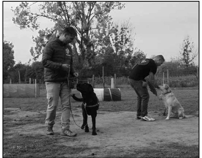
A kutyaiskola és az állatmentők bemutatója