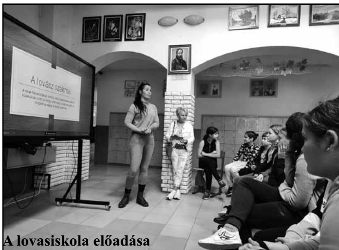
A lovasskola előadása

A délelőtt második felében a Tamzsi Kutyaiskola és az Életet az Állatoknak Egyesület önkéntesei tartottak tájékoztatót az állatmentők munkájáról, majd az iskola mögött felállított akadálypályán egy kutyás ügyességi bemutatónak is tanúi lehettünk. A tatai SiglavyCapriola Lovarda is bemutatkozott. Előadásukban kitértek a lovakkal kapcsolatos fontosabb tudnivalókra, valamint a loápolás és gondozás legfontosabb kérdéseire.