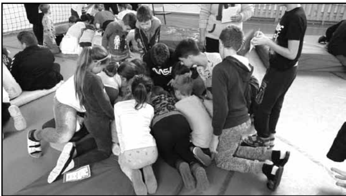
A délutáni csapatverseny