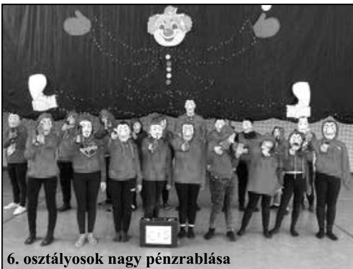
6. osztályosok nagy pénzrablása