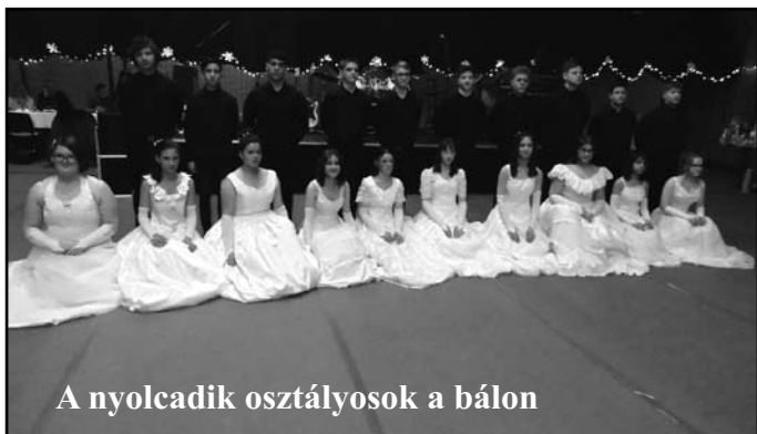
A nyolcadik osztályosok a bálon

ványunk és ez a rendezvényünk lehetőséget adott minderre. Bőjte Csaba ferences szerzetes így vall: „Aki nem hisz abban, hogy mennyi jó ember van, az kezdjen el valami jót tenni, és meglátja, milyen sokan odaállnak mellé.” E szép gondolat szellemében kaptunk jelentős anyagi támogatást, sok tombolatárgyat, és nem utolsósorban rengeteg segítséget, munkát. A bált hagyományaink szerint végzős tanulóink nyitották meg, néhány hetedikessel kiegészülve. Kerin-gőt táncoltak, melyet Kondics Gergely tanított be.