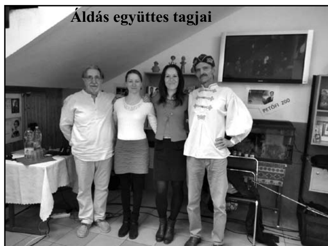
Áldás együttes tagjai