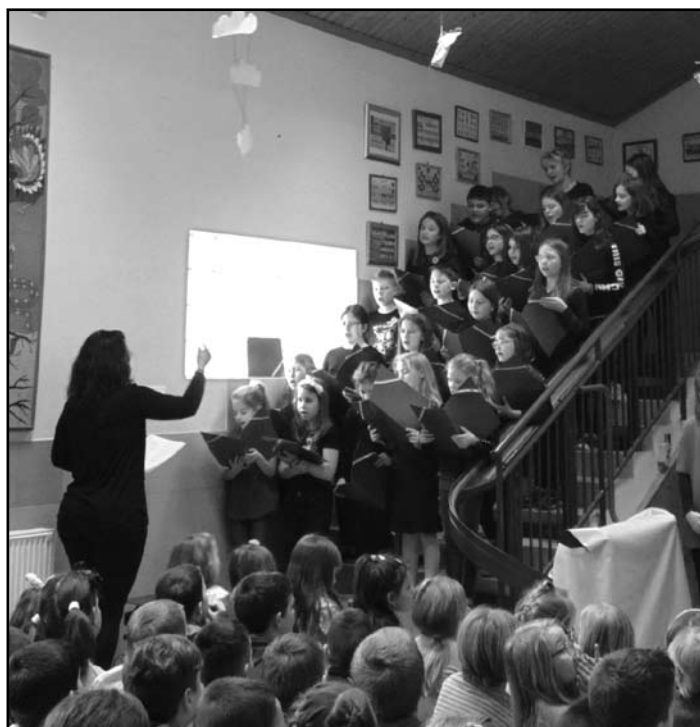
Énekkarunk az ünnepi műsoron

Köszönjük a gyerekek és felkészítőik munkáját!