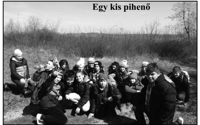
Egy kis pihenő

„Fafaragás után három órás túrára indultunk. Láttunk lábnyomokat, rókalyukat, fészket... A séta az étteremnél ért véget, ahol az ebéd zöldségleves és spagetti volt. Mikor megettük az enni- és innivalót, a szállásra mentünk. Már reggel lehúztuk az ágyneműket és öszszecsomagoltunk, úgyhogy nem volt semmi teendőnk, csak élvezni az utolsó pár percet. A lányokkal játszottunk. Maradtunk volna még, de nem lehetett. A visszaút jóval csendesebb volt, mint amikor Ravazdra mentünk. Én csak ajánlani tudom mindenkinek.”