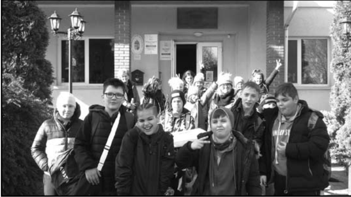
Az indulás pillanatai

Az ötödik osztály tanulói a tavaszi szünet előtt osztálykirándulásra mentek. A gyerekekkel erdei iskolai foglalkozáson vettünk részt.