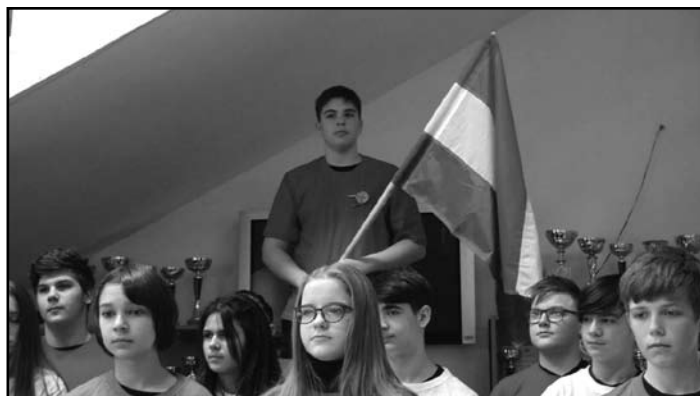
A 7. osztály műsora