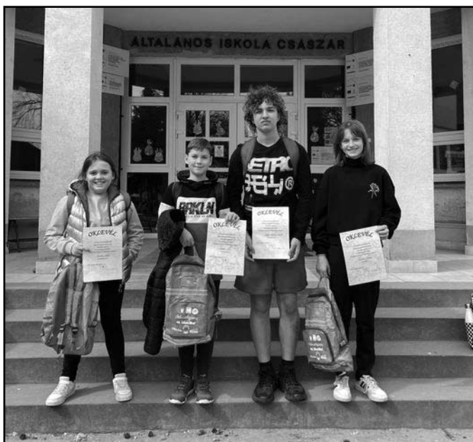
A kerékpáros verseny résztvevői