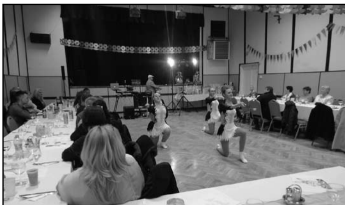
A mazzorett csoport műsora

Iskolánk Szülői Szervezete idén első alkalommal rendezte meg a Locsoló Bált.