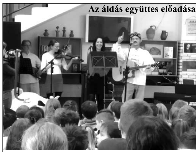
Az áldás együttes előadása