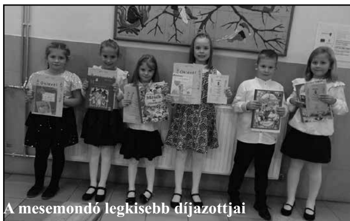
A mesemondó legkisebb díjazottjai