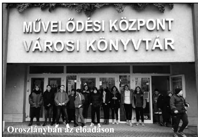
Oroszlányban az előadáson

November 24-én, pénteken a Budapest Táncszínházért Alapítvány jóvoltából 6. osztályosaink az orosz-lányi Kölcsény Ferenc Művelődési Központba látogattak. Itt megtekintették Verne „80 nap alatt a föld körül” című világhírű regényének színpadi feldolgozását. A zenés-táncos produkció méltán aratott sikert tanulóink körében.