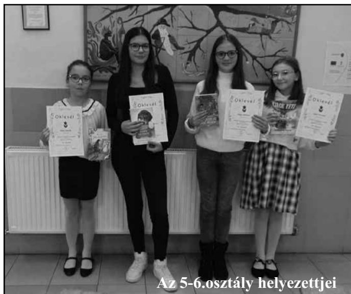
Az 5-6.osztály helyezettei