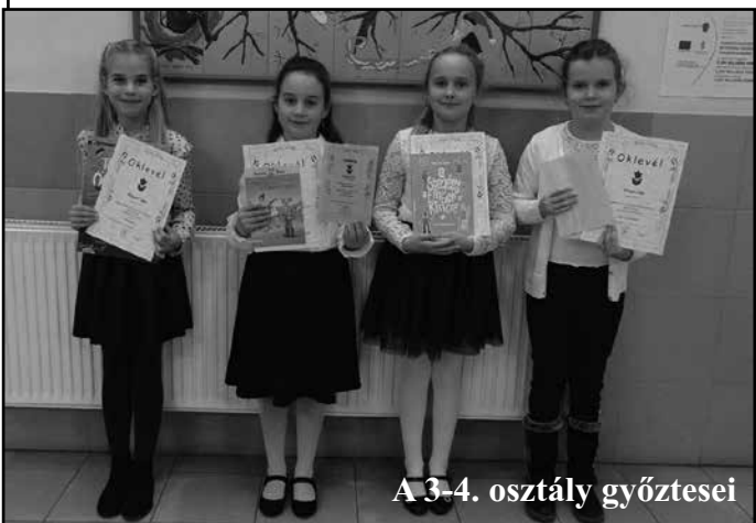
A 3-4. osztály győztesei