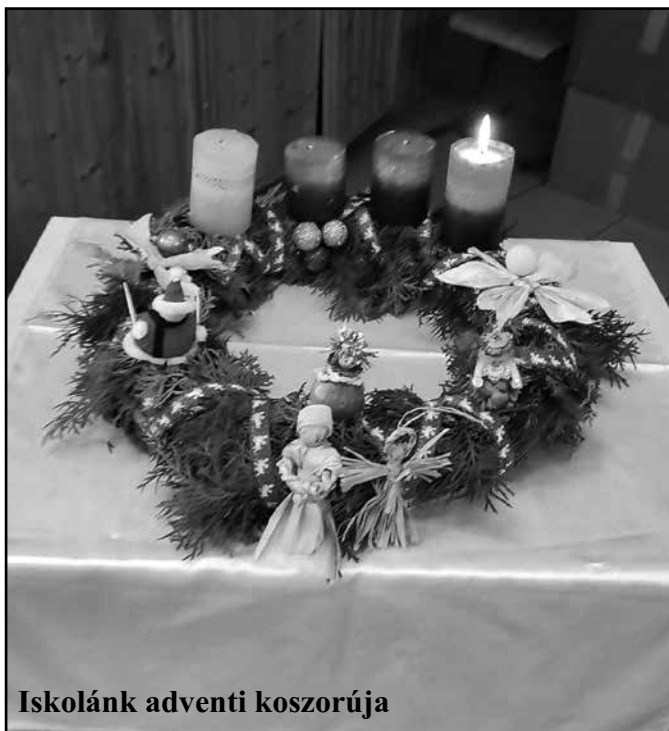
Iskolánk adventi koszorúja