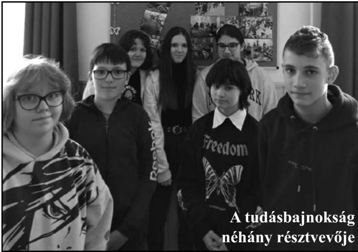
A tudásbajnokság néhány résztvevője