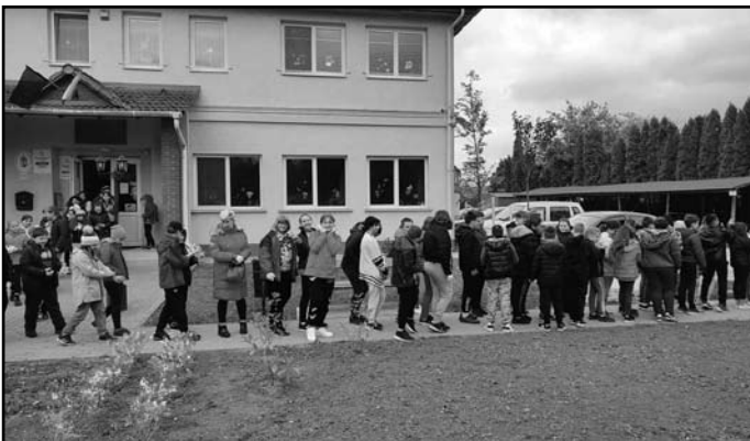
Szemétszedés a Föld napján

A Föld napja alkalmából iskolánk tanulói a település utcáit járva összegyűjtötték a szemetet. Ezzel a munkával segítettek közvetlen környezetünk védelmét és tisztaságát.