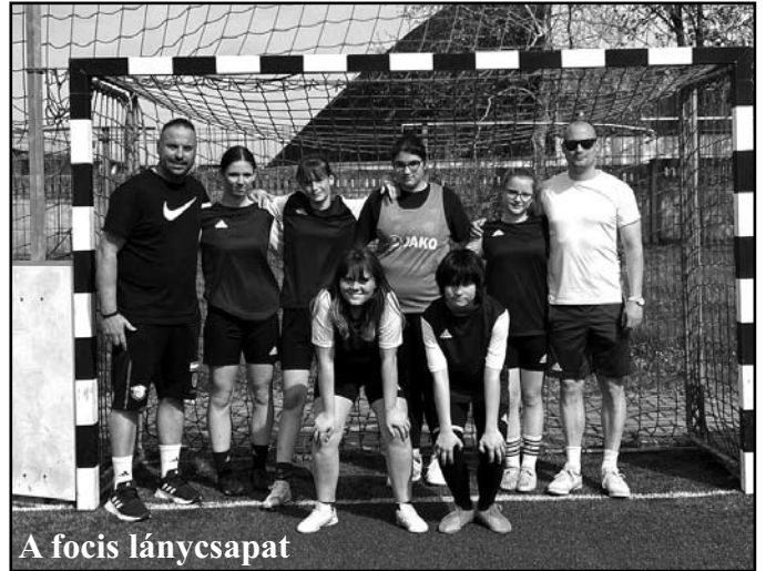
A focis lánycsapat

Nagyon ügyesek voltak a lányok, gratulálunk a szép eredményhez! Köszönjük az egyesület és a szülők segítségét.