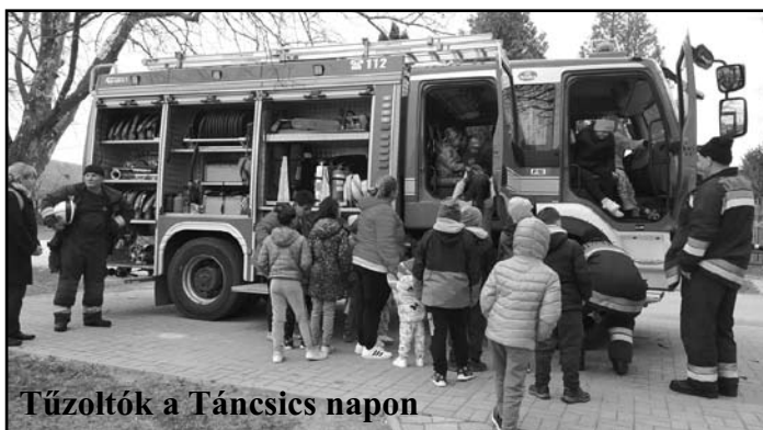
Tűzoltók a Tánccsics napon