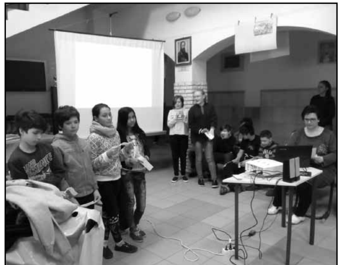
Megemlékezés a Tisza élővilágáról