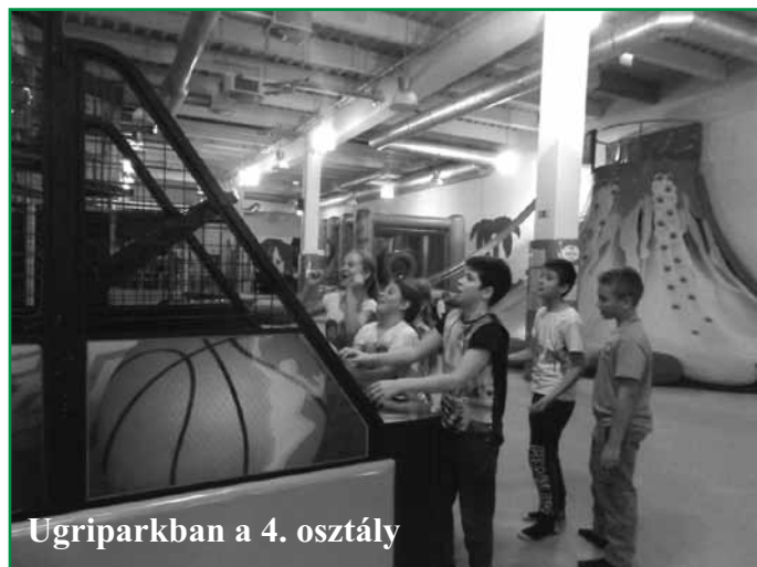
Ugriparkban a 4. osztály

Előző este én már aludni sem tudtam. Az iskolában alig vártuk, hogy vége legyen az óráinknak és indulhassunk ebédelni. Ebéd után már várt minket a busz. A szülőkkel együtt felszálltunk, és indultunk Győrbe. Amikor odaértünk és beléptünk az Ugriparkba, le kellett venni a cipőnket, így mehettünk csak bejatszani. A bejáratnál volt egy vulkánecsúszda, majdnem mindenki ott kezdett. Sokféle játék közül választhattunk, mindent kipróbáltunk. Nekem legjobban az óriás trambulin és az ugrálóvár tetszett. Amíg mi játszott-