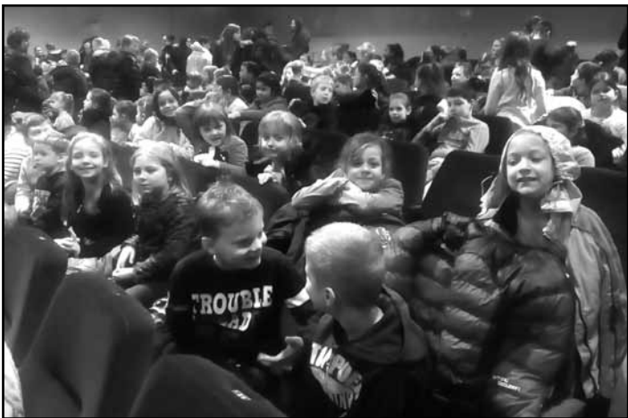
Színházban a legkisebbek

Az elmúlt hónapban alsósaink mindennapjaiban két olyan esemény szerepelt, ami egy kicsit felpezsdítette őket. Az egyik egy színházlátogatás volt Kisbéren, a Wass Albert Művelődési Központban. Február 14-én látogattunk el ide, ahol a Szépség és szörnyeteg című zenés mesejátékot tekinthették meg a Nektár Színház művészei előadásában. Élményekben gazdagon tértek haza növendékeink.