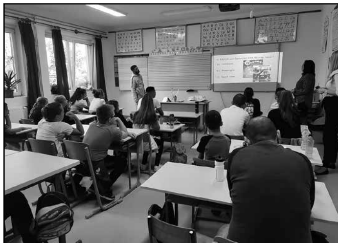
ismerkedés Benedek Elek életével