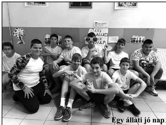
Egy állati jó nap.

- Állatvédelmi Témahét. Képeket készítettünk a gyerekekről úgy, hogy rajtuk volt a díszített napszemüveg. A TikTokon összeváltuk a képeket zenére és posztoltuk a videót a már említett megadott szöveggel. A gyerekek nagyon élvezték ezt a fiatalos kampányt.