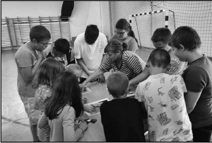
Vetélkedő a Benedek Elek napon