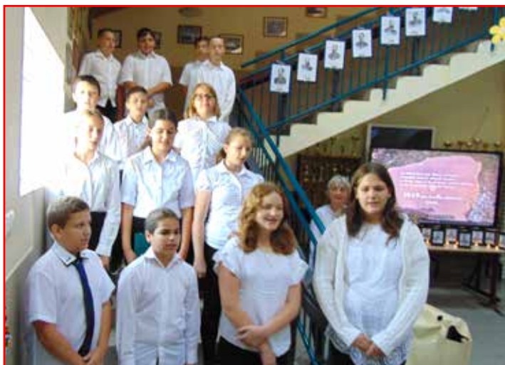
Megemlékezés október 6

Iskolánk 6. osztályos tanulójának verses-zenés műsorával emlékeztünk az 1849. október 6-án kivégzett hősökre. A műsorban a tanulók felidéztek a vértanúk életét, kivégzésük körülményeit, ezzel tisztelve a szabadságharc nemes ügyét és a tábornokok emléke előtt.