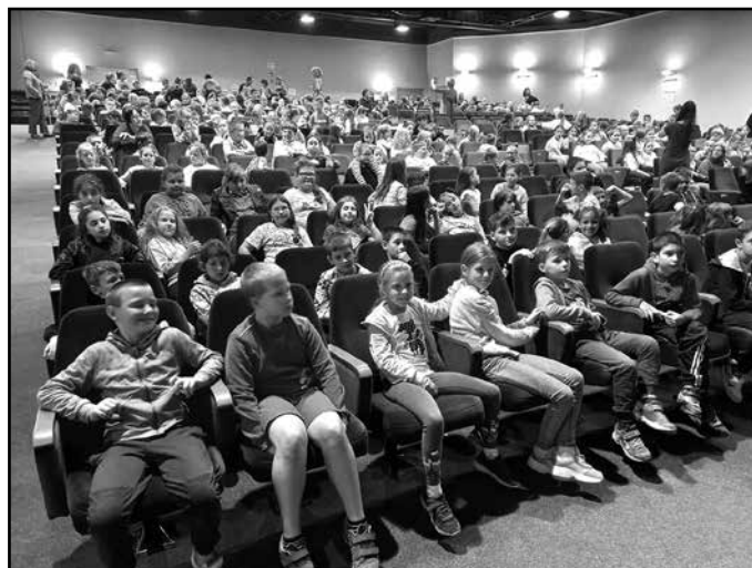
A 3. és 4. osztályosok a Lázár Ervin programon