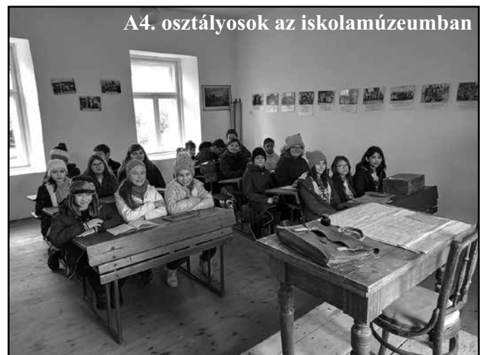
A4. osztályosok az iskolamúzeumban