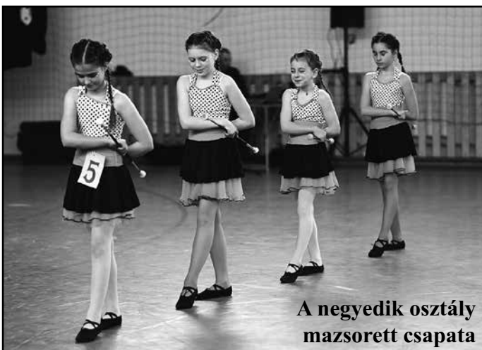
A negyedik osztály mazzorett csapata