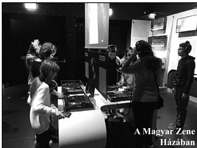
A Magyar Zene Házában

Ehhez a budapesti úthoz kapcsoltuk a Magyar Zene Házának a megtekintését is. Ez az Európa és tengeren túli díjakat nyert állandó kiállítás hihetetlen zenei élményt adott diákjainknak. A „Hangdimenziók – Uta-