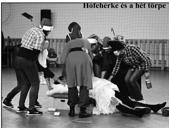
Hófehérke és a hét törpe