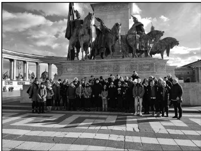
A Hősök terén

S ha már a Városligetben jártunk, nem maradhatott ki a több mint 13.000 négyzetméteres parkrésze közel félszáz különleges játékelemet tartalmazó Nagyjátszótér. Ennek központi eleme egy háromszintes mászóka, amelyet Szinyei Merse Pál Léghajó című festménye inspirált.