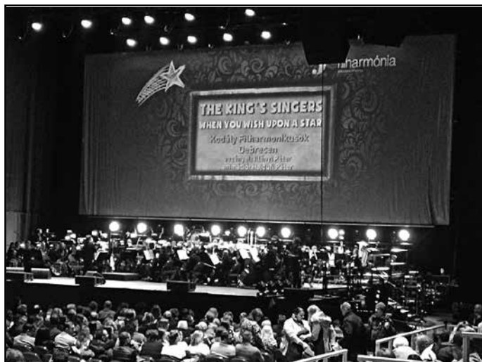
A Disney 100 koncerten

Az ifjúsági hangversenybérletünkben található harmadik koncertet most beválthattuk a The King's Singers angol énekegyüttes Disney 100 lemezbe-mutató koncertjére. Azaz ifjúsági bérletes diákjaink bérleteikkel ingyen vehetnek részt ezen a nagyszerű hangversenyen a Papp László Sportarénában.