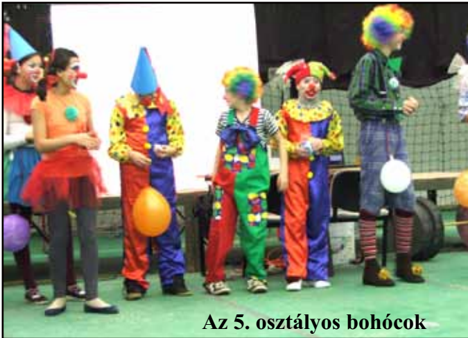
Az 5. osztályos bohócok