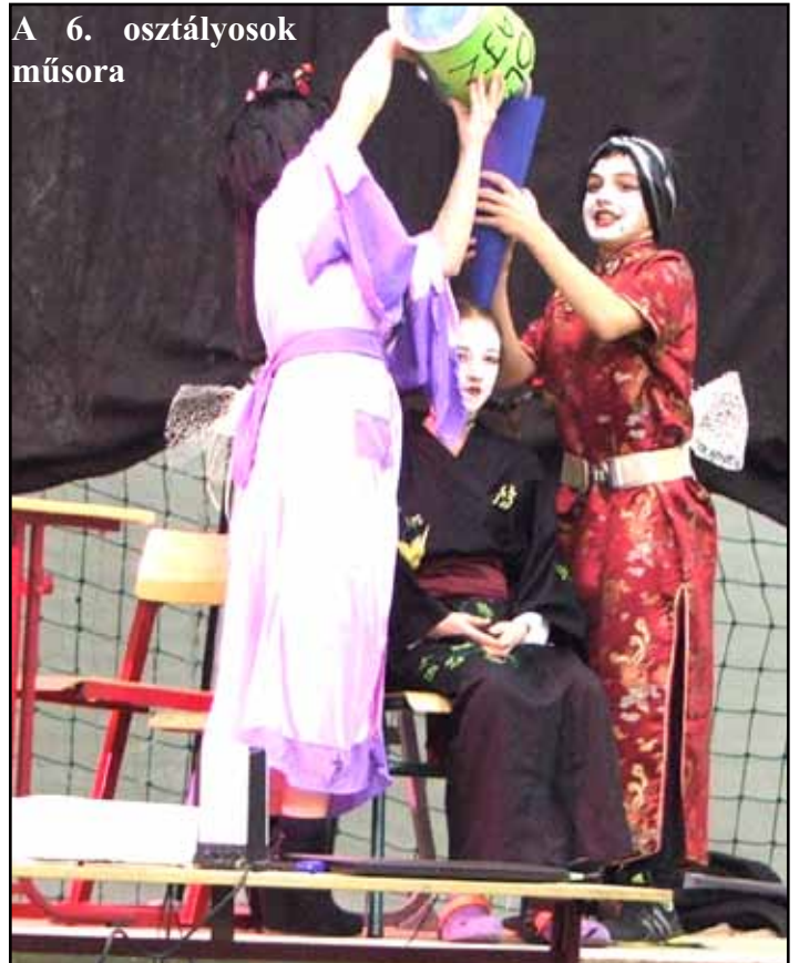
A 6. osztályosok műsora