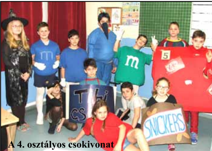
A 4. osztályos csokivonat