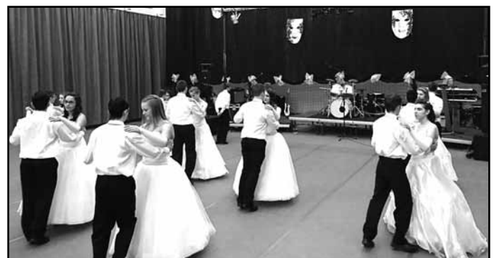
A tánc pillanatai