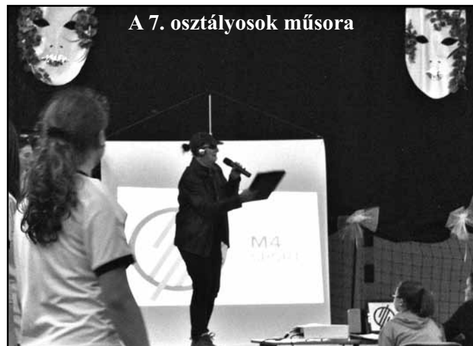
A 7. osztályosok műsora

Nagy sikere volt a tombolasorsolásnak is. A büfében finom sütemények és szendvics várta a kedves vendégeket.